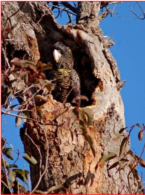
Betina Kakatua Hutan Hitam Ekor Merah di dalam sarang