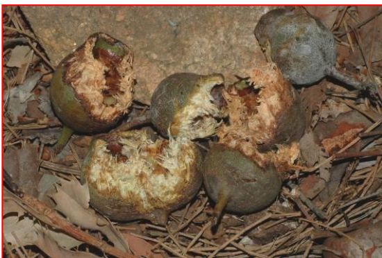
Biji Marri dimakan oleh Kakatua Hutan Hitam Ekor Merah